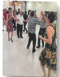
Les Compagnons du Folklore de Trois-Rivières

ET « LES COMPAGNONS DU FOLKLORE DE TROIS-RIVIÈRES »